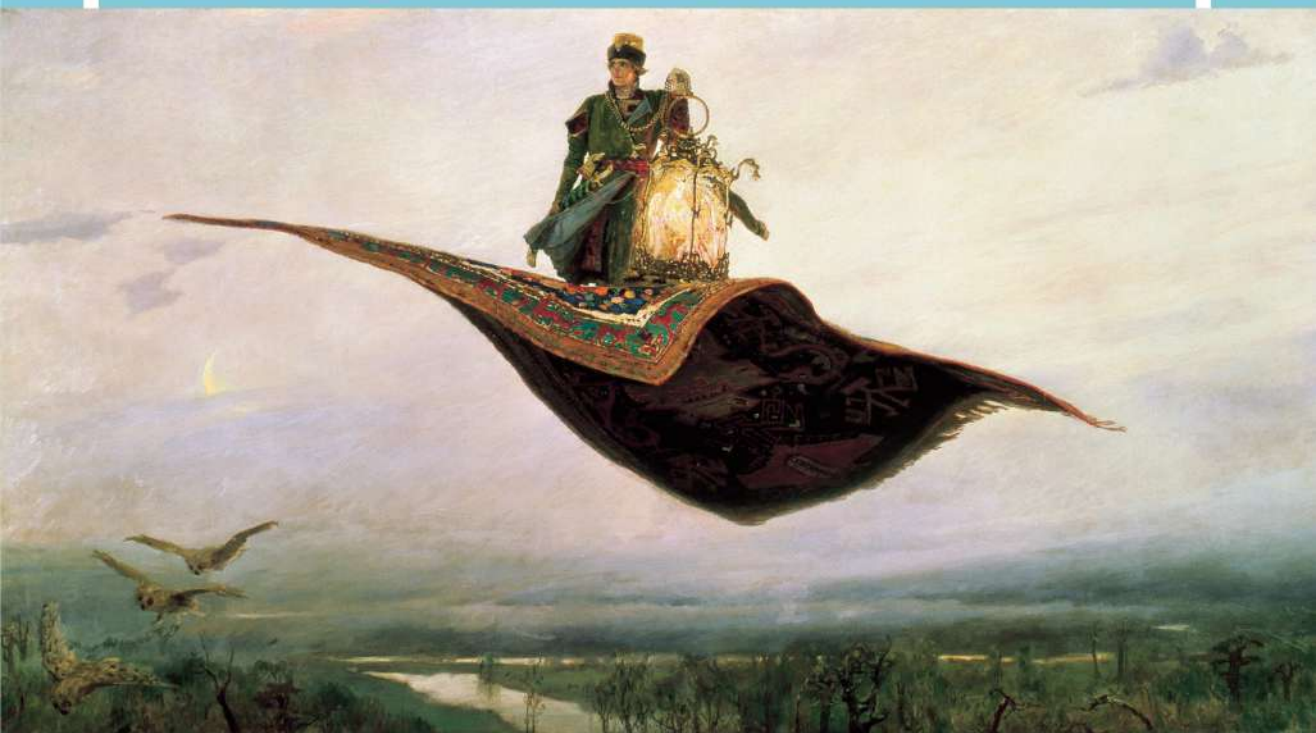
В.М. Васнецов «Ковёр-самолёт»